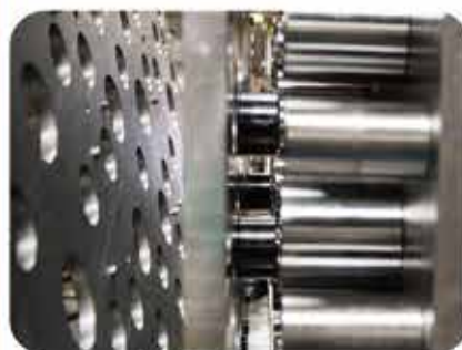
应用范畴：塑胶模具行业