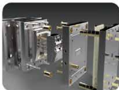
应用范畴：模具行业