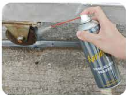
应用范畴：导轨、滑轨等轨道润滑领域