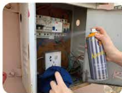
应用范畴：电子行业清洗